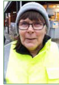
Christina Andersson När det lider mot jul Carola Häggkvist