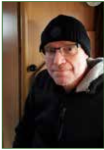
Mikael Granlund